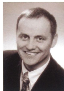
Josef Geisler Bürgermeister und Landtagsabgeordneter