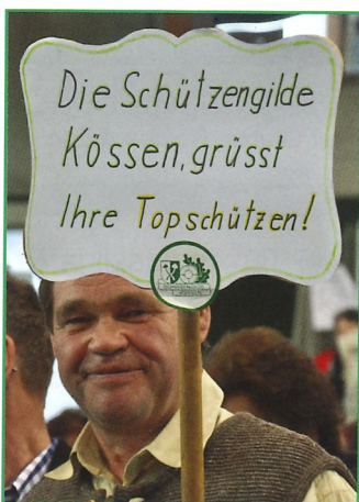
Auch dieser Fan fand den Weg ins Zillertal.

Die Veranstaltung vom 16. und 17. März in Zell am Ziller war Sportschützenwerbung pur. Ein